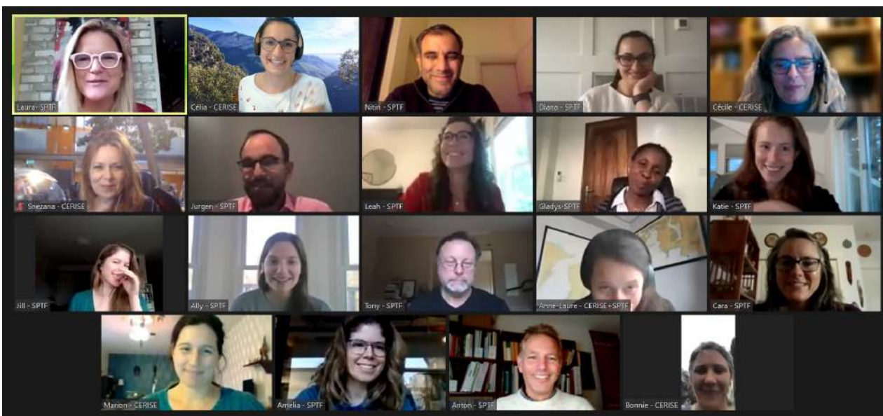
L'équipe CERISE+SPTF réunie sur Zoom en décembre 2021 !

Au programme de CERISE+SPTF : gérer le Parcours de Protection des Clients , construire le Réseau des Professionnels de la GPS , modérer le Groupe de travail des investisseurs sociaux , discuter avec les régulateurs, mettre à jour les Normes Universelles conformément aux nouvelles exigences environnementales et sociales, et proposer un cadre de reporting standard et une stratégie pour gérer les résultats, en lien avec les ODD. Un plan d'action motivant et ambitieux !